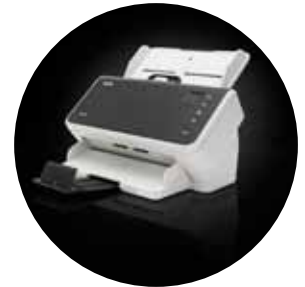
Escáneres S2040/S2050/S2070 Alaris